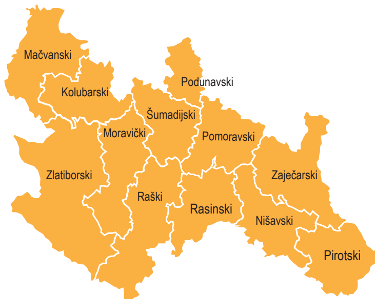
Slika 1 – Teritorije na kojima se sprovodi poziv